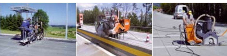
«POSSEHL» Техника для нарезки и герметизации швов, для ремонта трещин

« POSSEHL THERMOFLEX » для разграничения при помощи цвета границ бетонных и асфальтных поверхностей, напр. для перекрестков, велосипедных дорожек и т.п.