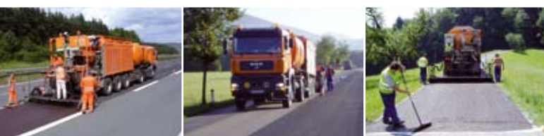
«POSSEHL DSK» - Тонкие слои асфальта в холодной укладке – для быстрого, экономичного и экологически безвредного ремонта проезжей части при холодной укладке

АВТОСТРАДЫ ФЕДЕРАЛЬНЫЕ, ОБЛАСТНЫЕ, РАЙОННЫЕ ДОРОГИ ГОРОДСКИЕ ДОРОГИ АВТОМОБИЛЬНЫЕ ДОРОГИ МЕСТНОГО НАЗНАЧЕНИЯ ХОЗЯЙСТВЕННЫЕ ПРОЕЗДЫ ВЕЛОСИПЕДНЫЕ/ ПЕШЕХОДНЫЕ ДОРОЖКИ МОСТЫ ТОННЕЛЬНЫЕ УЧАСТКИ ШКОЛЬНЫЕ ДВОРЫ ПЕШЕХОДНЫЕ ЗОНЫ