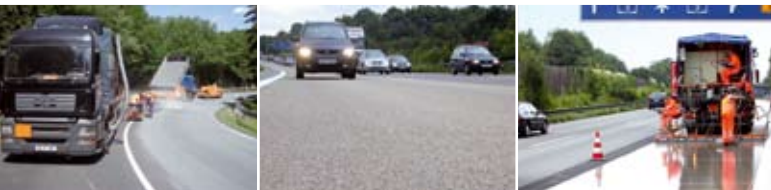
«POSSEHL EP-GRIP» для улучшения шероховатости покрытий, а также для уменьшения шума

АВТОСТРАДЫ ФЕДЕРАЛЬНЫЕ, ОБЛАСТНЫЕ, РАЙОННЫЕ ДОРОГИ ГОРОДСКИЕ ДОРОГИ АВТОМОБИЛЬНЫЕ ДОРОГИ МЕСТНОГО НАЗНАЧЕНИЯ ХОЗЯЙСТВЕННЫЕ ПРОЕЗДЫ ВЕЛОСИПЕДНЫЕ/ ПЕШЕХОДНЫЕ ДОРОЖКИ МОСТЫ ТОННЕЛЬНЫЕ УЧАСТКИ ШКОЛЬНЫЕ ДВОРЫ ПЕШЕХОДНЫЕ ЗОНЫ