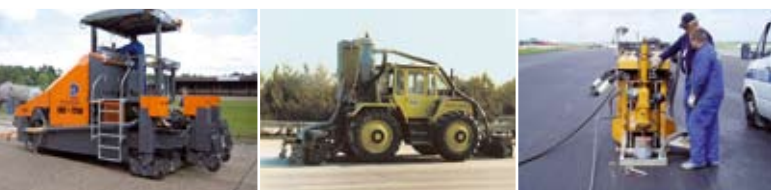
«POSSEHL» Техника для шлифовки и улучшения шероховатости покрытий, техника для нарезки канавок и для бурения кернов

« POSSEHL » Техника для шлифования и восстановления шероховатости для улучшения шероховатости покрытия на бетонных и асфальтных проезжих частях