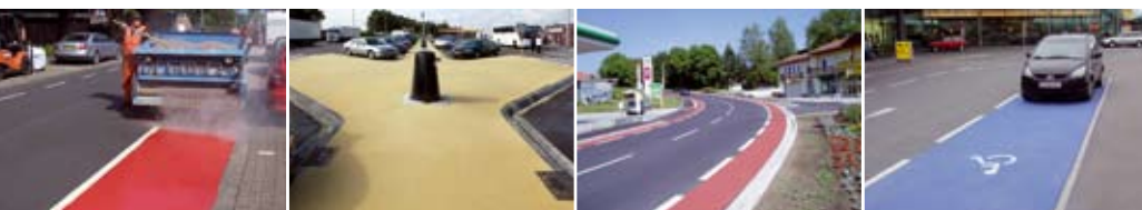
POSSEHL THERMOFLEX для повышения безопасности движения посредством цветного обозначения границ

« POSSEHL DSK » Тонкие слои асфальта в холодной укладке согласно ZTV BEA-StB 3) и TL BEA-StB 4) для экономичного и экологически безопасного сохранения субстанции дорожной поверхности, улучшения шероховатости покрытий и устранения колеи асфальтного покрытия