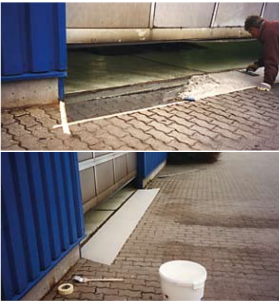
Herstellen einer Anrampung