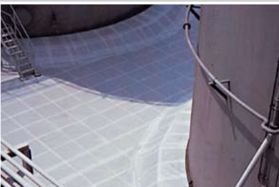
Glasfitterarmierung in bituminöser Auffangwanne