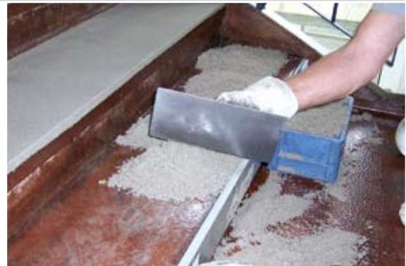
Treppeninstandsetzung. Vorher ...