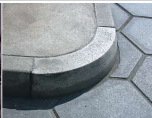
Fugenabdichtung im Wirkbereich