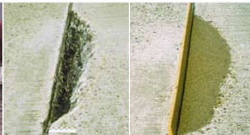
Schadhafte und mit cds®-Mörtel sanierte Fugenkante