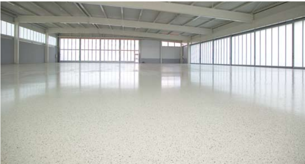
Hochbelastbarer cds®-Industrieboden mit Chipeinstreuung in einer Flugzeugwartungshalle