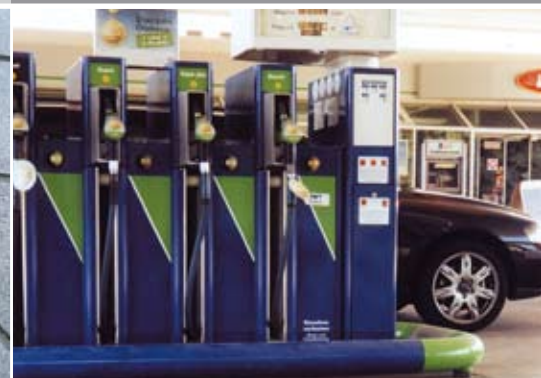
cds®-Beschichtung TS im Tankstellenbereich mit Prüfzeugnis nach WHG

In umweltsensiblen Bereichen, wie z.B. der Petrochemie, kann es durch Leckagen zu einer Gefährdung der Umwelt kommen. Auch das tägliche Betanken von Kraftfahrzeugen an Tankstellen mit unvermeidlichen Treibstoffverlusten stellt eine potenzielle Gefährdung für Boden, Grundwasser und Oberflächengewässer dar. Hier hat der Gesetzgeber in § 19 g WHG (Wasserhaushaltsgesetz), dem sogenannten „Besorgnisgrundsatz“, Sicherungsmaßnahmen festgeschrieben, um eine Kontaminierung der Umwelt zu verhindern (VAwS, BetrSichV).