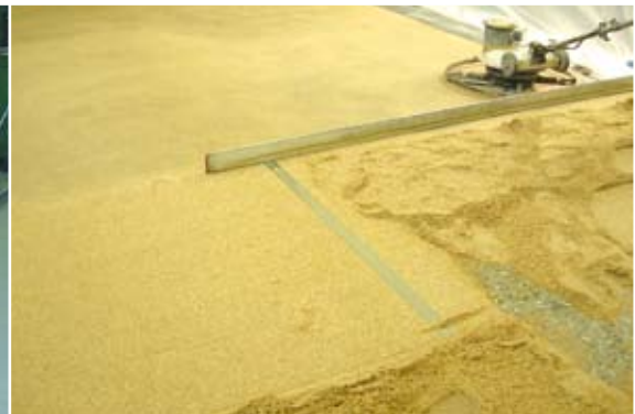
Farbige Gestaltung auf Kundenwunsch

Produktionsausfallzeiten werden minimiert durch unseren POSSEHL Epoxidharz-Estrich . Der laserunterstützte maschinelle Einbau garantiert eine optimale Qualität mit gleichzeitig hoher Flächenleistung, auch in unterschiedlichsten Schichtdicken. Bereits nach wenigen Stunden kann der Estrich beschichtet werden.