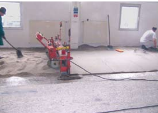
Laserunterstützter Einbau von Epoxidharz-Estrich