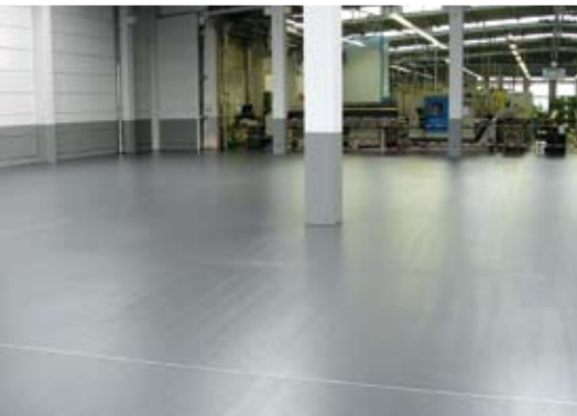
cds®-Industrieböden: Abriebfester Belag in einer Lagerhalle