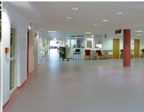
Hygienische und pflegeleichte Beschichtung in einem Krankenhaus