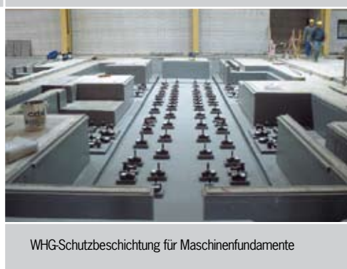
WHG-Schutzbeschichtung für Maschinenfundamente