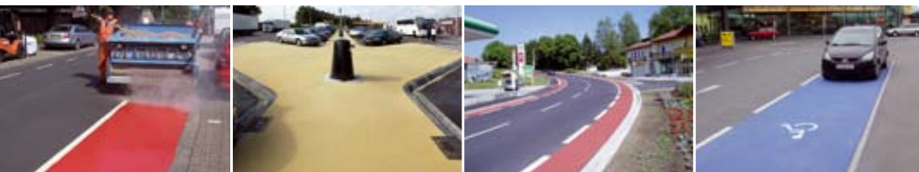
POSSEHL THERMOFLEX zur Erhöhung der Verkehrssicherheit durch farbige Abgrenzung

POSSEHL DSK Dünne Schichten im Kalteinbau gemäß ZTV BEA-StB und TL BEA-StB zur wirtschaftlichen und umweltverträglichen Substanzerhaltung, Griffigkeitsverbesserung und Spurrinnenbeseitigung von Asphaltdecken