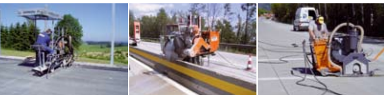
POSSEHL Schneid- und Fugentechnik, Rissanierung