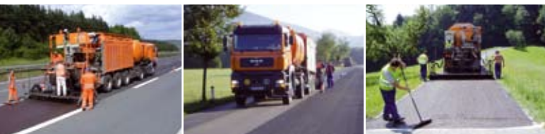
POSSEHL DSK – Dünne Schichten im Kalteinbau zur schnellen, wirtschaftlichen und umweltverträglichen Fahrbahnsanierung im Kalteinbau

POSSEHL EP-GRIP gemäß ZTV BEB-StB und TL BEB-StB zur Steigerung der Griffigkeit und Rollgeräuschminderung