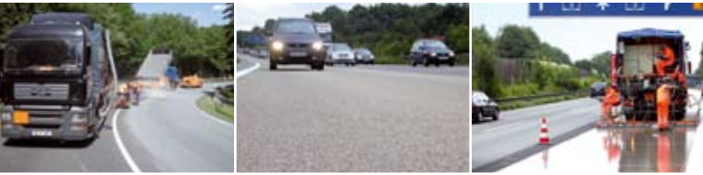
POSSEHL EP-GRIP zur Griffigkeitserhöhung und Rollgeräuschminderung

AUTOBAHNEN BUNDES-, LANDES- UND KREISSTRASSEN STADTSTRASSEN GEMEINDESTRASSEN WIRTSCHAFTSWEGE RADWEGE / GEHWEGE BRÜCKEN TUNNELSTRECKEN SCHULHÖFE FUSSGÄNGERZONEN