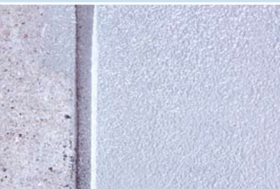
Beschichtete Fläche mit Kopfröllung und Fugenverguss (links vorher - rechts nachher)