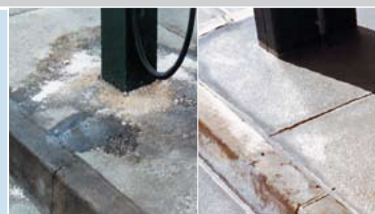
Sanierte Fläche (links vorher - rechts nachher)